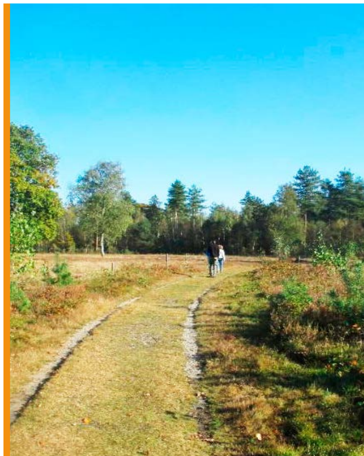
en heerlijke herfstwandeling op de hei bij Wezep ...

En op facebook vindt u de meest actuele informatie. We geven met regelmaat een update.