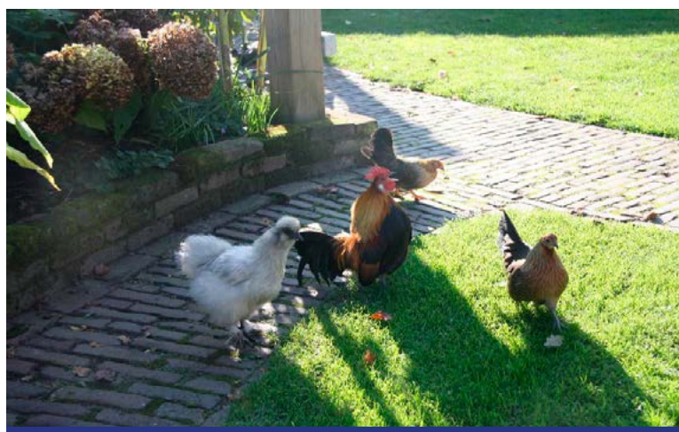
Een nieuw koppeltje kippen met een echte haan geniet van onze tuin.

werking in de vorm van een maatschap, blijft ons Calimero-formaat onze kracht: korte lijntjes, veel nabijheid, samen leven, samen groeien, zorg op maat, intens betrokken.